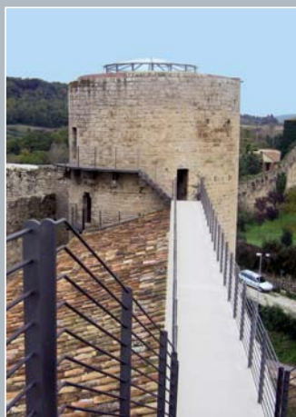
Staggia Senese (SI)