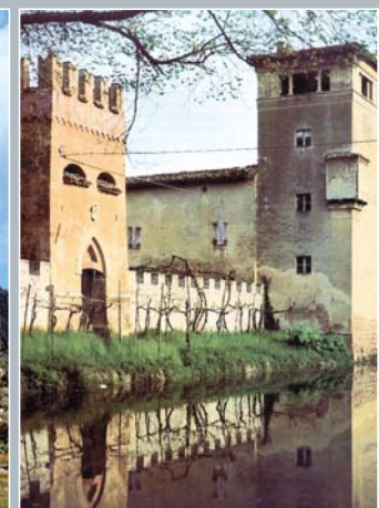
Torre de Picenardi (CR)