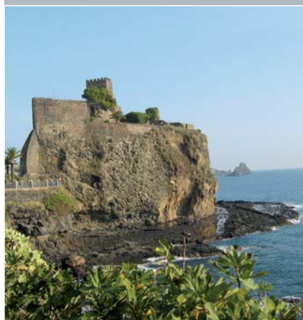
ACI Castello (CT)