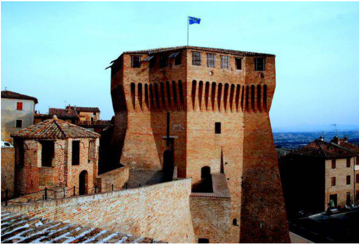
Mondavio, Rocca Roveresca

I castelli raccontano la storia di un Paese e del suo territorio, le sue trasformazioni sociopolitiche, la ricchezza e diversità dei luoghi, insieme alle storie affascinanti di persone, famiglie e dinastie. Una ricostruzione storico-culturale resa possibile grazie all'attività di studiosi, docenti universitari, architetti, restauratori, saggisti e grazie al contributo fondamentale di studenti e volontari. Tutti impegnati nella conduzione delle visite al pubblico.