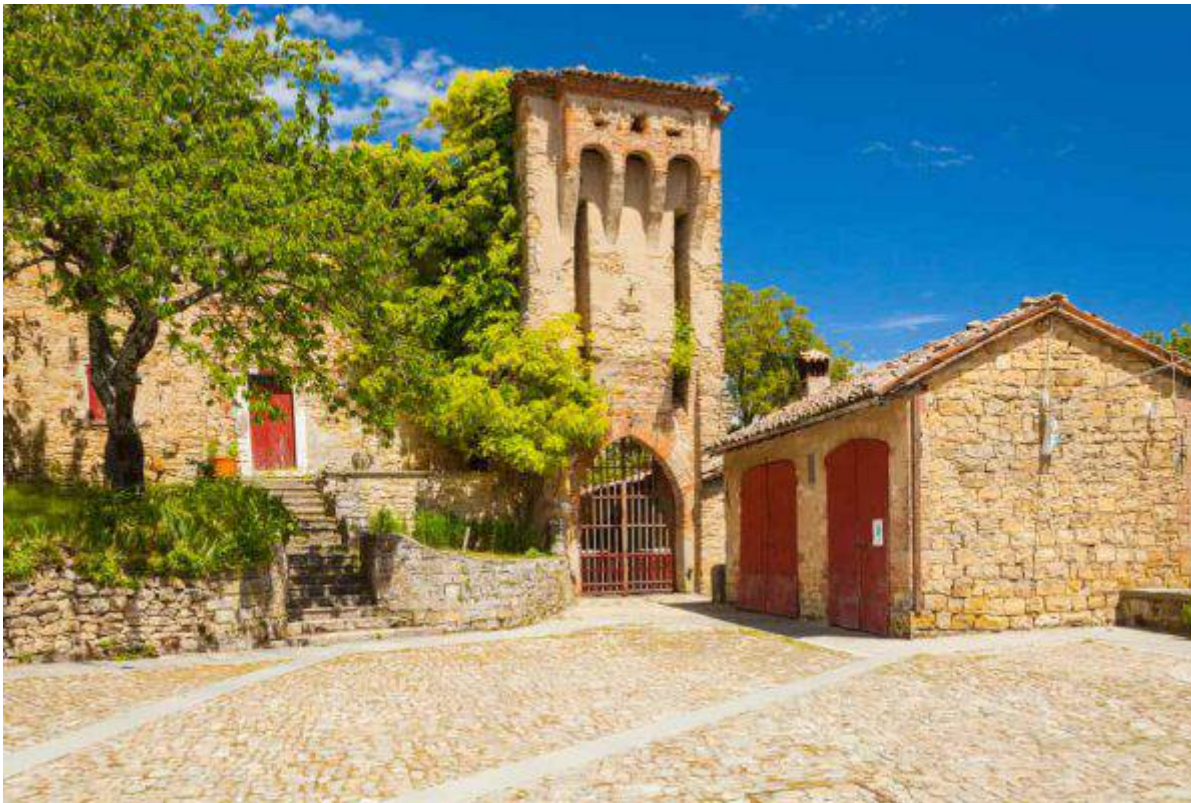
Castello di Montefestino , Serramazzone, Modena

Di Valeria Bellagamba - 2 Maggio 2019 ULTIMO AGGIORNAMENTO 18:44