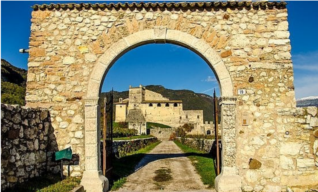
Castello di Noarna, Trentino

Oltre alle iniziative del weekend 11-12 di maggio si segnalano eventi in date diverse, in particolare di quest'anno è la cinta muraria di Vicenza con il suo torrione - vengono aperti con visite guidate sempre maggio), Forte di Monte Tesoro Vicenza (19 maggio), Castello di Thiene (25 maggio), Castello di Ro (isola della laguna veneta, 8 giugno) e Forte San Felice (Chioggia 15 giugno).