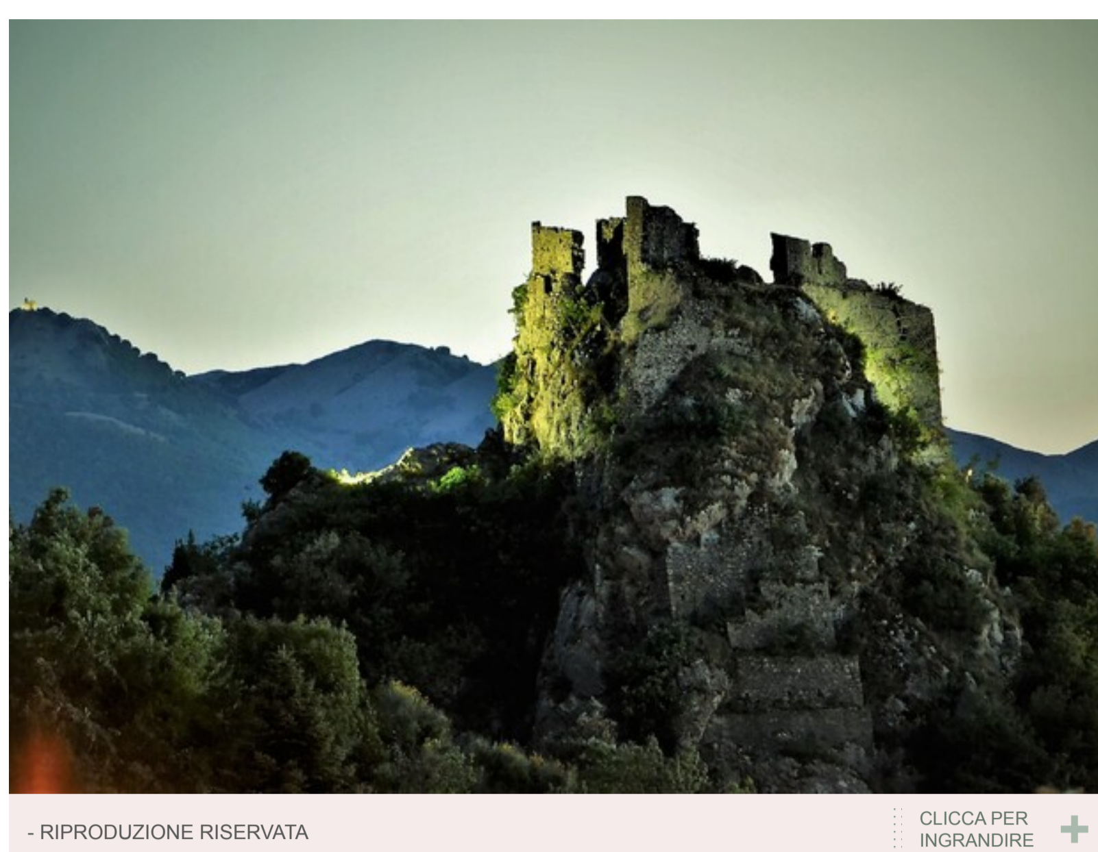
- RIPRODUZIONE RISERVATA CLICCA PER INGRANDIRE

Di Cinzia Conti ROMA 23 settembre 2022 18:00