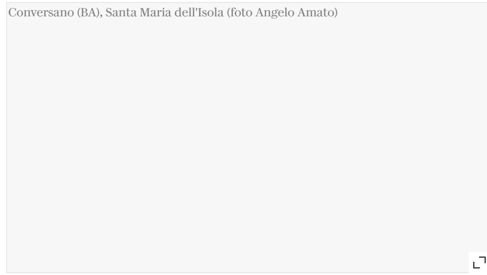
▲ Conversano (BA), Santa Maria dell'Isola

I soci volontari della sezione Marche dell'Istituto Italiano Castelli piantano i riflettori, sia sabato 13 che domenica 14 maggio, sul borgo di Acquaviva Picena, nell'immediato entroterra di San Benedetto del Tronto, con la sua ben conservata fortezza. È un borgo fortificato, munito di ben otto torri poligonali e cilindriche con tre porte di ingresso al recinto e un rotondo torrione detto "Fortezza verso mare". In direzione opposta si erge invece la "Fortezza magione", una poderosa fortificazione picena, prima e romana dopo, già compare in documenti risalenti al 947. La fortezza è un esempio di architettura rinascimentale e ogni estate diventa lo scenario per il Fallo del Duca, rievocazione storica delle nozze nel 1234 tra la bellissima Forasteria d'Acquaviva con Rainaldo di Brunforte, signore di Mogliano.