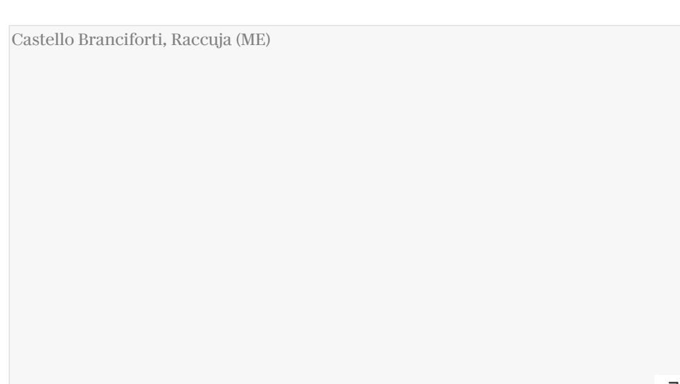
▲ Castello Branciforti, Raccuja (ME)

E se in questo week end non si riuscirà a vederne molti, prendete nota. Il 16, 17, 23 settembre, in concomitanza con le Giornate Europee del Patrimonio, si replica. Per la prima volta, la manifestazione include anche delle date a fine estate, inizio autunno, riaprendo gli stessi siti di maggio ma anche alcuni selezionati solo per queste date.