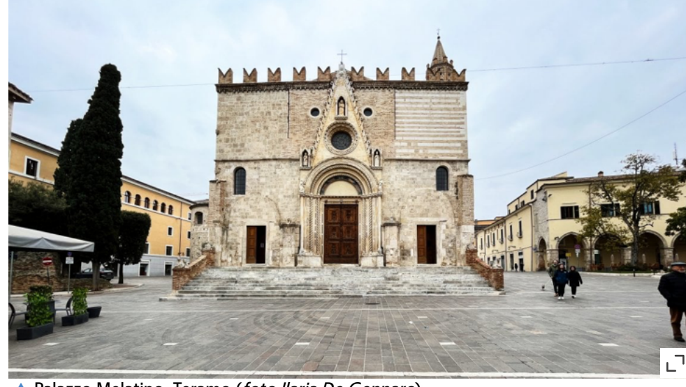
▲ Palazzo Melatino, Teramo

In Veneto, a Mestre, l'attenzione è sul Castelnuovo ed il Castelvecchio. Oltre alle visite dei siti ed a un convegno, sono previste due passeggiate patrimoniali guidate alla Mestre medievale con partenza dalla Torre dell'Orologio: l'obiettivo è l'indagine archeologica sulle tracce dei castelli scomparsi, dove i partecipanti potranno vivere una vera e propria caccia al tesoro, alla ricerca della Mestre antica diluita nella grande città contemporanea. Tra le novità, la ricostruzione virtuale della "Mestre Medievale", i ragazzi delle Scuole Medie della città (Istituto comprensivo Bernini) hanno ricostruito con stampanti 3D il Castelnuovo di Mestre nell'anno 1405 e il piadino rende bene l'idea di come era un tempo: ponti levatoi, bastioni, canali, scali fluviali, mercati, palazzi, in un'esperienza storica-didattica originale.