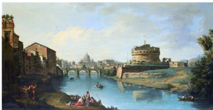
Fondato nel 1964 sede legale - Roma

DONA IL 5 X 1000 ALL'ISTITUTO ITALIANO DEI CASTELLI