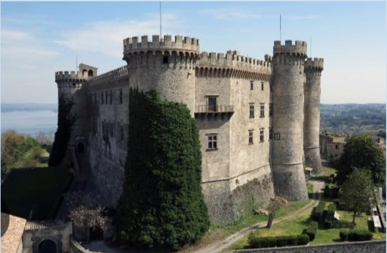
Bracciano, Castello Orsini Odescalchi (seconda metà del XV sec.)